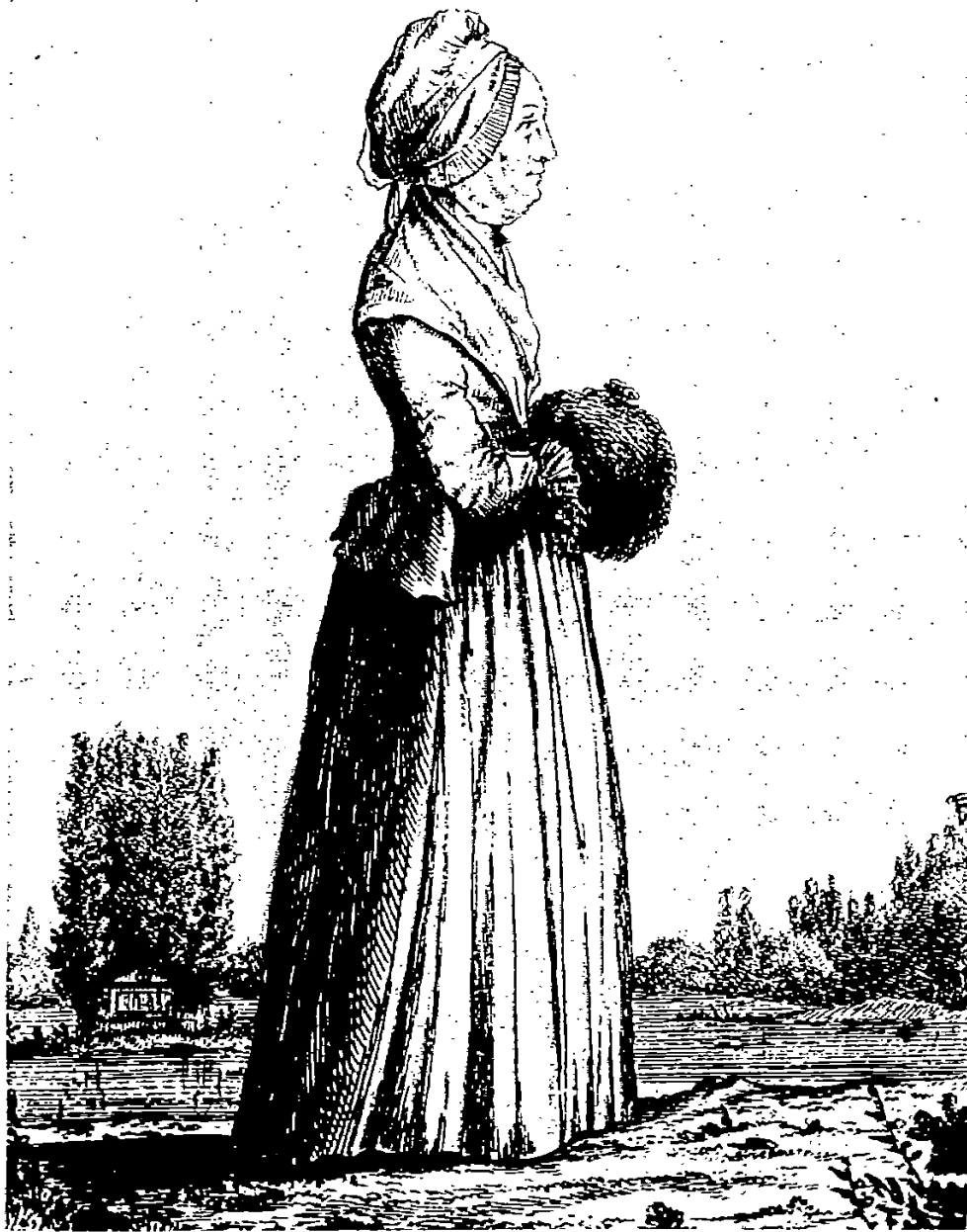
THÉRÈSE, FEMME DE J.-J. ROUSSEAU