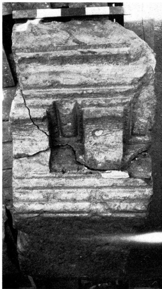
14 et 15 Genainville. Les Vaux de la Celle. Bloc sculpté sur deux faces.