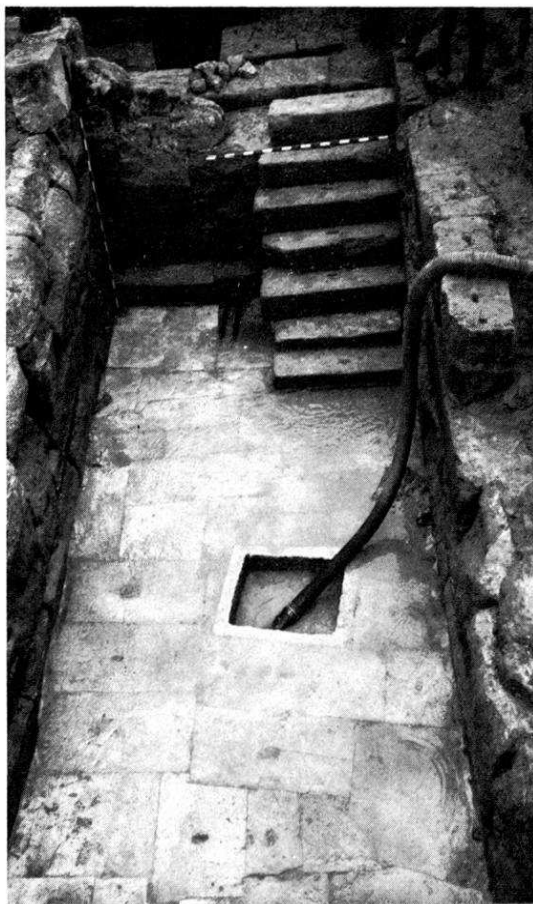
13 Genainville. Les Vaux de la Celle. Le bassin n° 3.