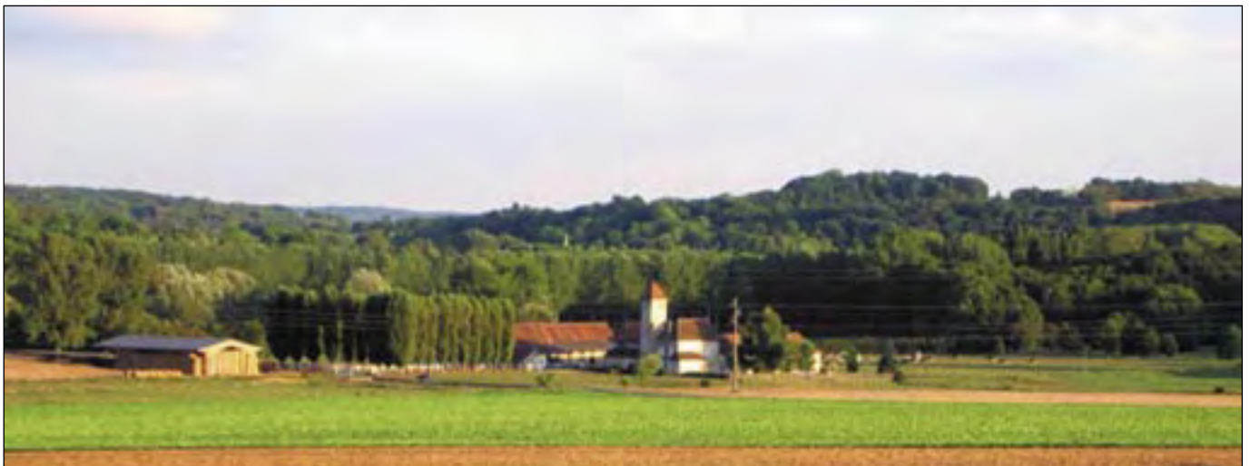
Après la disparition de la distillerie, la ferme de Launay, a retrouvé son splendide isolement. Seuls, les fils électriques de la ligne à haute tension apportent une note de modernité et gênent... le photographe !